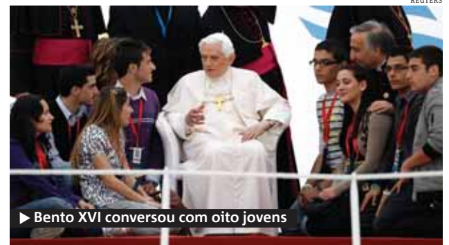
► Bento XVI conversou com oito jovens

Bento XVI rezou com as vítimas e assegurou que a Igreja fará todo o possível para investigar as acusações. ● AGÊNCIAS