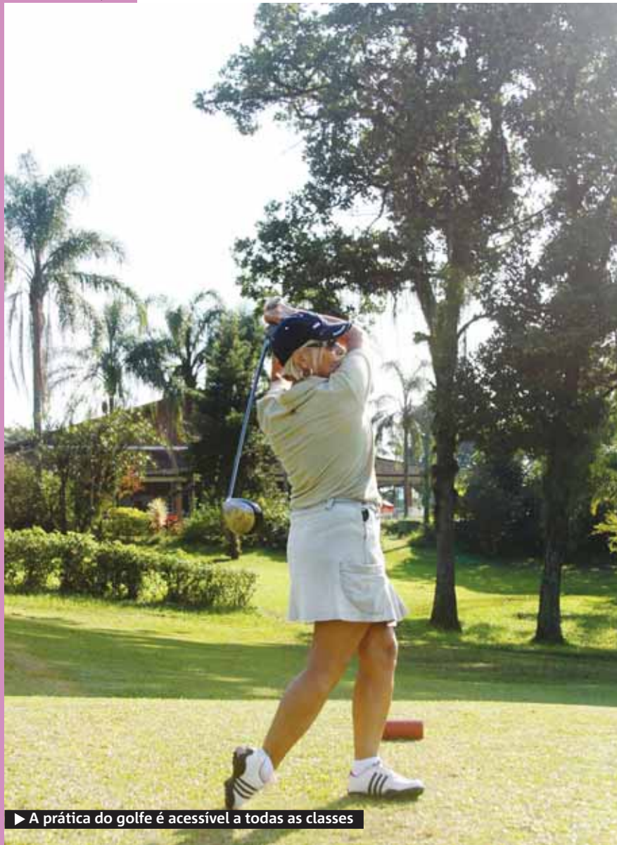
► A prática do golfe é acessível a todas as classes