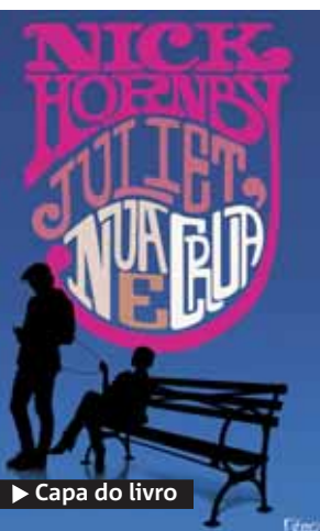
► Capa do livro