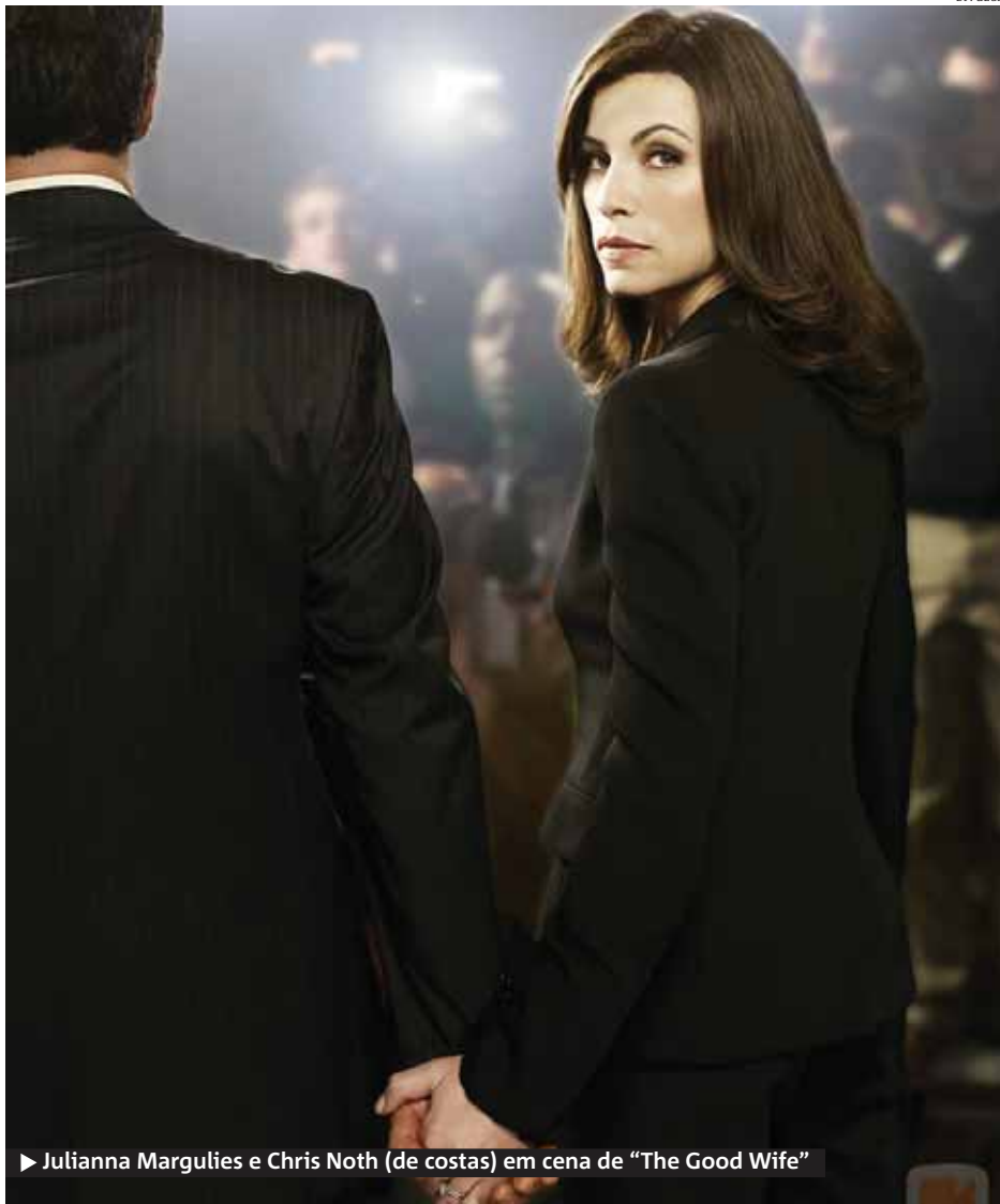
► Julianna Margulies e Chris Noth (de costas) em cena de "The Good Wife"