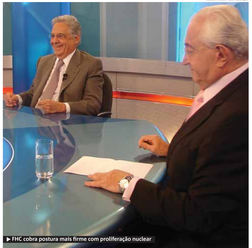
► FHC cobra postura mais firme com proliferação nuclear