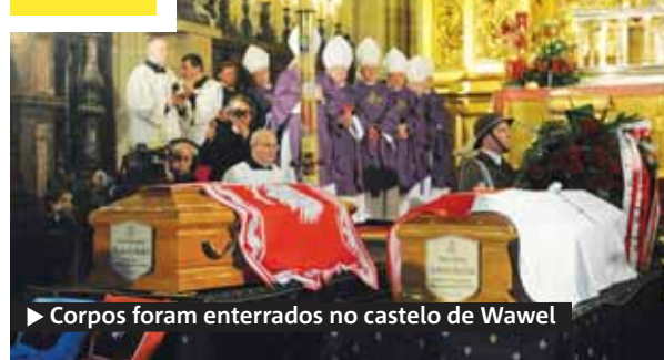
► Corpos foram enterrados no castelo de Wawel