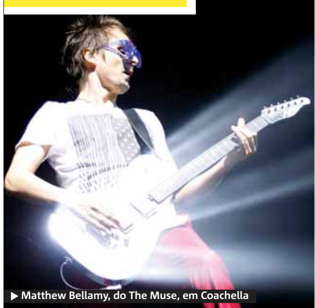
► Matthew Bellamy, do The Muse, em Coachella