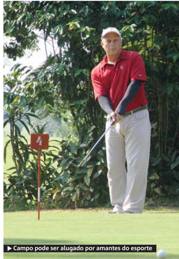
► Campo pode ser alugado por amantes do esporte