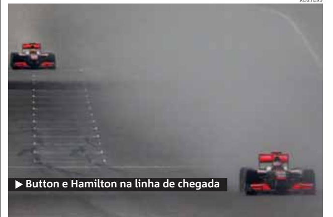
► Button e Hamilton na linha de chegada

Jenson Button (McLaren) venceu ontem o GP da China de Fórmula 1 e assumiu a liderança do campeonato.