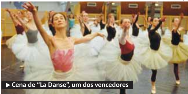
► Cena de “La Danse”, um dos vencedores