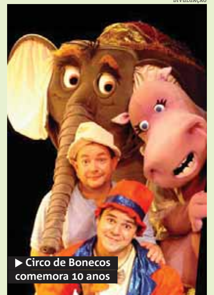
▶ Circo de Bonecos comemora 10 anos