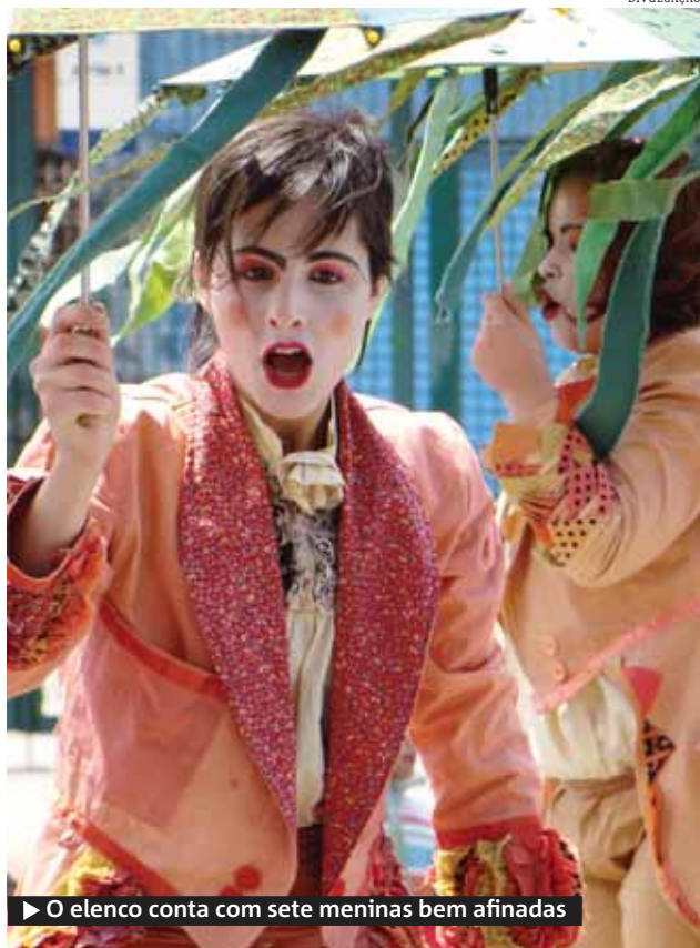
▶ O elenco conta com sete meninas bem afinadas