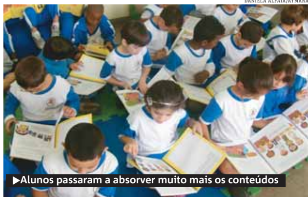
► Alunos passaram a absorver muito mais os conteúdos