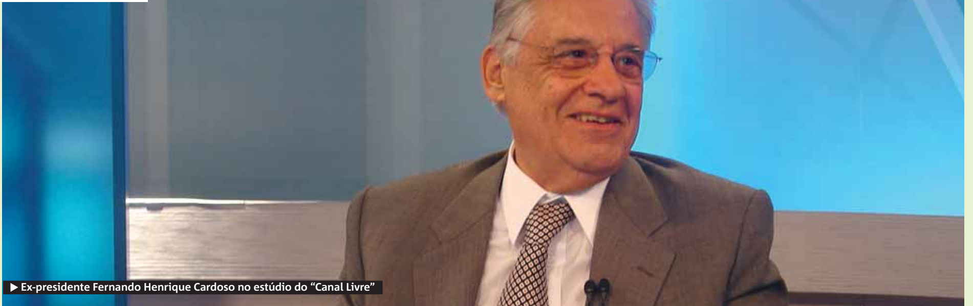
► Ex-presidente Fernando Henrique Cardoso no estúdio do "Canal Livre"