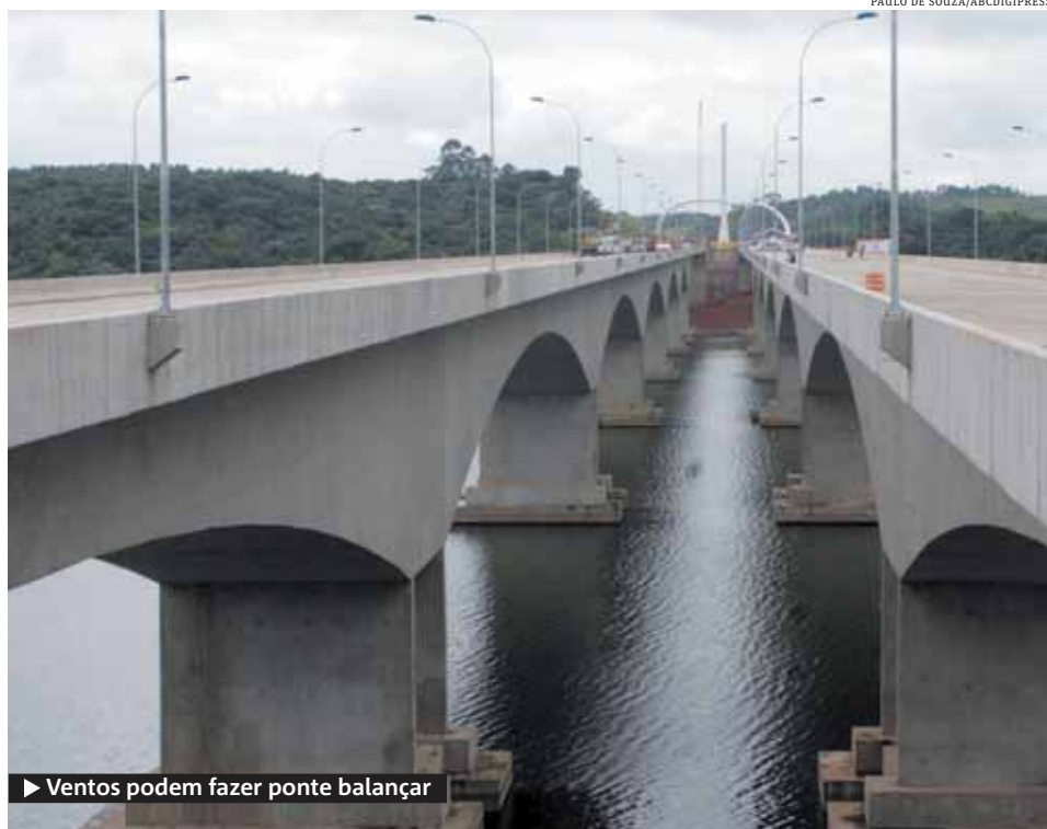
► Ventos podem fazer ponte balançar

metros de extensão possui a ponte que passa sobre a Billings, na divisa entre São Bernardo e a capital. Ela é a maior do trecho sul do Rodoanel.