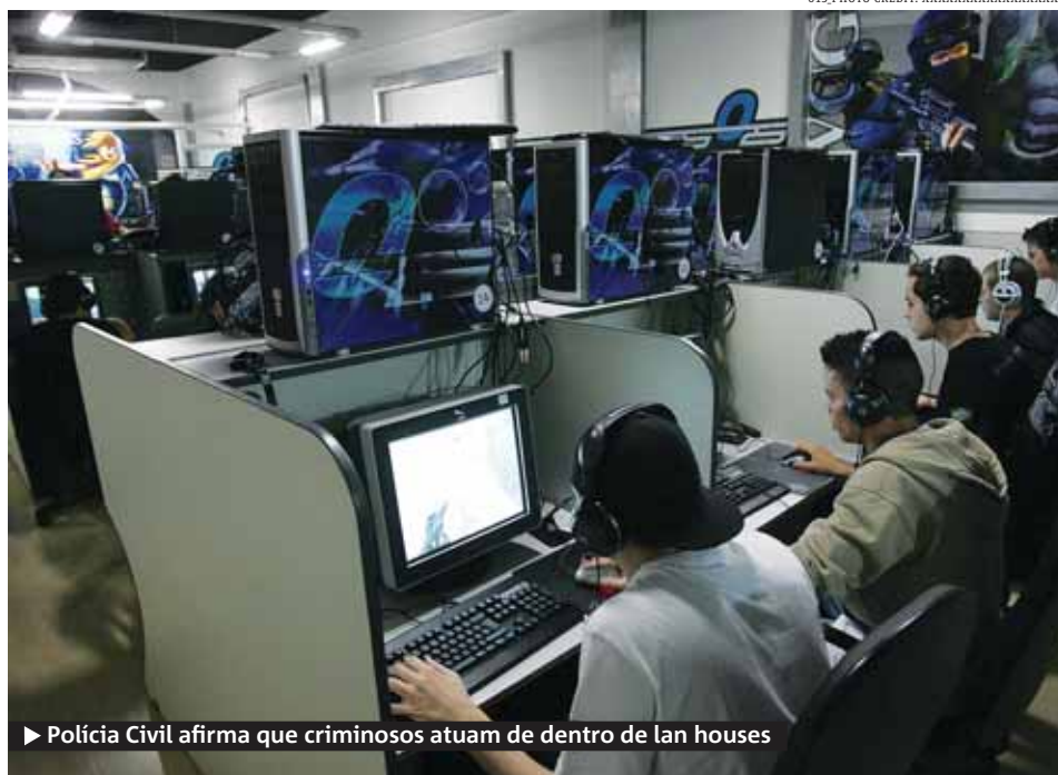
► Polícia Civil afirma que criminosos atuam de dentro de lan houses

Há diversos sites na internet onde é possível abastecer o celular com o pagamento feito pelo cartão.