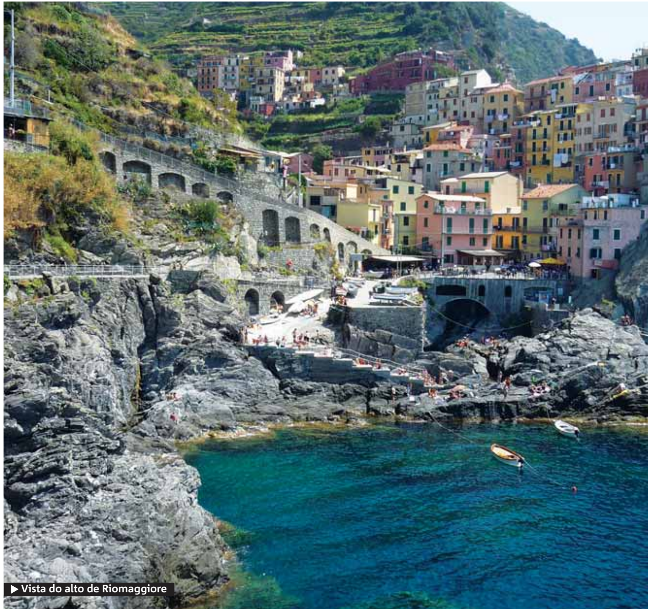
► Vista do alto de Riomaggiore