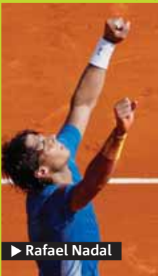
► Rafael Nadal