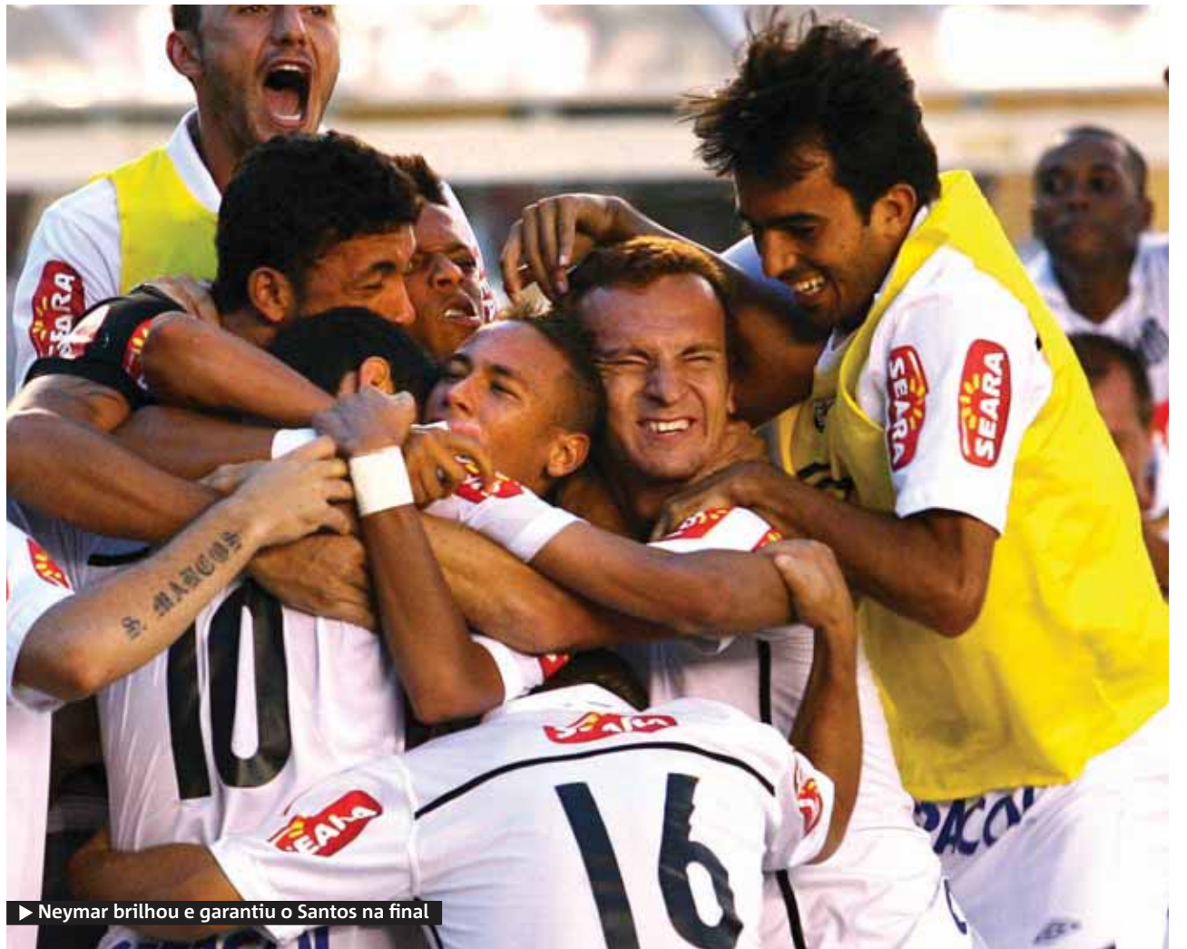
► Neymar brilhou e garantiu o Santos na final