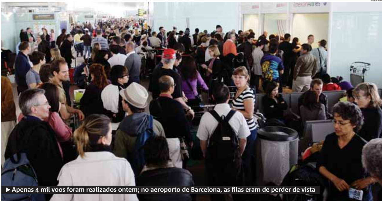
► Apenas 4 mil voos foram realizados ontem; no aeroporto de Barcelona, as filas eram de perder de vista