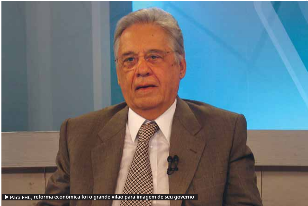
► Para FHC, reforma econômica foi o grande vilão para imagem de seu governo

Boris Casoy – O senhor acredita que no Brasil seja possível uma campanha de alto nível, que contemple o debate e a análise dos temas importantes do país? Porque, até hoje, isso não tem acontecido.