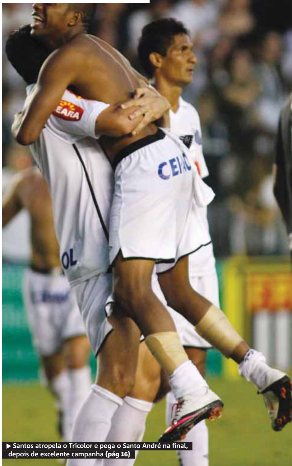
▶ Santos atropela o Tricolor e pega o Santo André na final, depois de excelente campanha {pág 16}