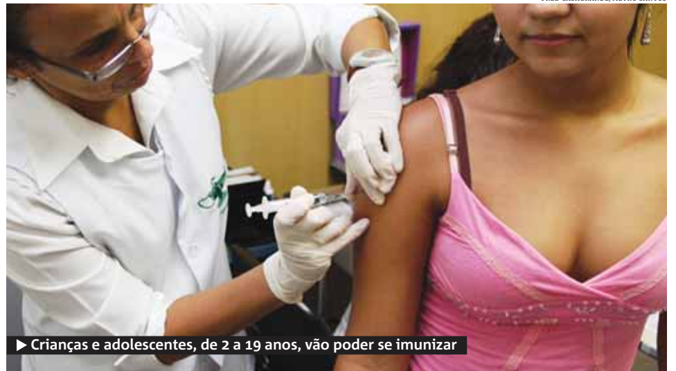
► Crianças e adolescentes, de 2 a 19 anos, vão poder se imunizar

A próxima fase terá início no dia 24 e tem como alvos idosos com mais de 60 anos ou portadores de doenças crônicas. ● METRO SANTOS