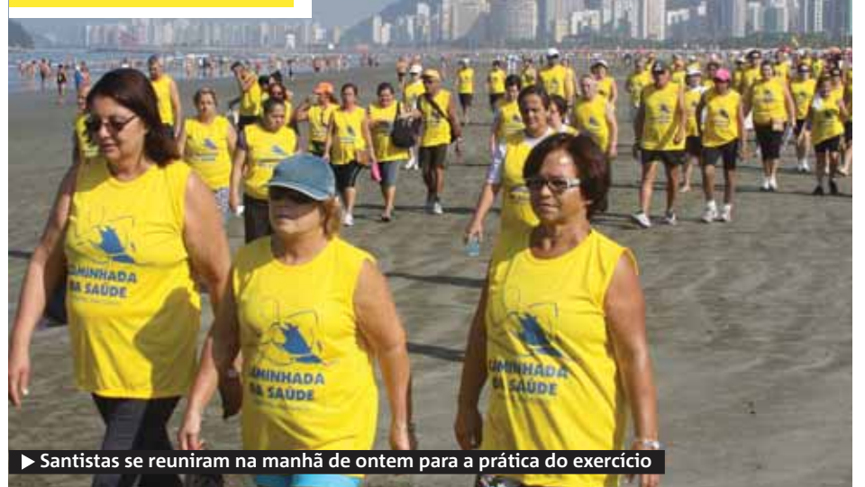
► Santistas se reuniram na manhã de ontem para a prática do exercício